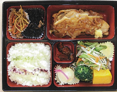
信州ポーク生姜焼弁当 1,200円