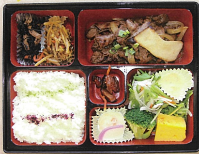
アルプス牛焼肉弁当 1,600円