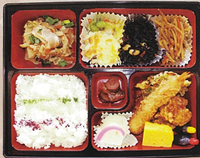
幕の内弁当 (写真は1,080円のお弁当です) 864円～