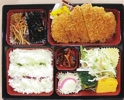
信州ポークとんかつ弁当 1,200円